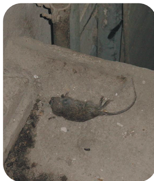
Carogna di ratto soppresso con veleni