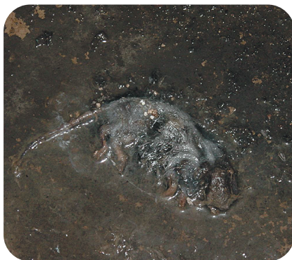
Carogna di ratto in avanzato stato di decomposizione